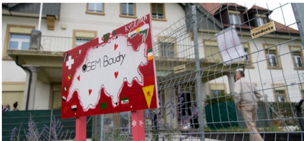
Jour de la visite à Boudry, 2018.

https://www.osar.ch/revision-de-la-loi-sur-lasile.html