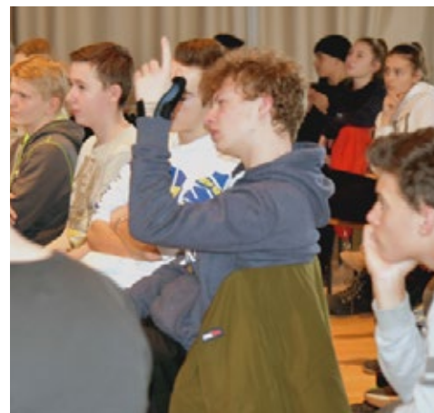
Le changement de perspectives amène les jeunes à réfléchir par eux-mêmes aux motifs de fuite.