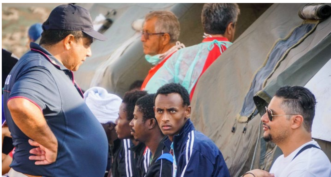
La Suisse a adressé 36% de ses demandes d'admission à l'Italie.

L'exemple d'une femme turque ayant déposé une demande d'asile en Suisse après y être entrée par l'Italie montre quelles sont les conséquences de cette pratique rigoureuse pour les intéressés. Les autorités suisses ont transféré la personne en Italie sans avoir clarifié sa prise en charge ultérieure. Or, cette femme atteinte d'un syndrome de stress posttraumatique suivait un traitement psychiatrique à Zurich et présentait un risque de suicide. Livrée à elle-même, elle a,