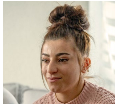
Rebar et Ward cherchent un apprentissage.

discriminés, que ce soit en Irak, leur pays d'origine, ou ailleurs.