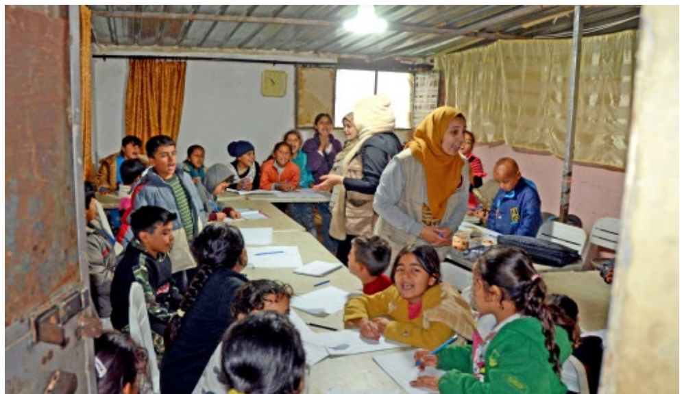
Jour de classe pour des enfants réfugiés syriens dans le camp informel de Sarada, Sud-Liban.

De plus en plus de réfugiés vivent dans des logements insalubres et surpeuplés. Officiellement, le gouvernement n'autorise pas les camps et on estime que seul 15 pourcents vivent dans des camps informels. La majorité vit dans des immeubles résidentiels situés dans des villes ou villages, souvent à la